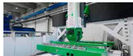
HAGEmatic FSW70-2-D für Bodenplatten

Mit der Verbindung aus FSW-Technologie und automatisierter Bearbeitung positioniert sich HAGE als verlässlicher Partner für die industrielle Fertigung von Komponenten in der stetig wachsenden Schienenindustrie – präzise, effizient und zukunftsorientiert.