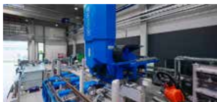
Bearbeitungsanlage für Stahlschienen

Schutzgase. Eine vollautomatische Prozessüberwachung sichert konstante Nahtqualität. HAGE kombiniert Bearbeitung und simultanes Schweißen von oben und unten – ein klarer Produktivitätsvorteil in der Serienfertigung.