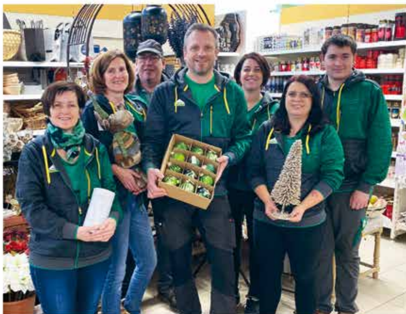
Das Team vom Lagerhaus Bad St. Leonhard bedankt sich herzlich für Ihre Treue und ihr Vertrauen und wünscht frohe Weihnachten im Kreis Ihrer Familie und einen guten, gesunden Start ins neue Jahr!

Raiffeisen-Lagerhaus Lavanttal reg.Gen.m.b.H. Bahnhofstraße 154, 9462 Bad St. Leonhard Tel: 04350/2330 stleonhard@lagerhaus-lavanttal.at www.lagerhaus-lavanttal.at