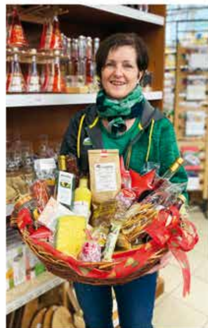
Regionale Genussgeschenke werden mit viel Liebe zur Region nach Kundenwunsch zusammengestellt.