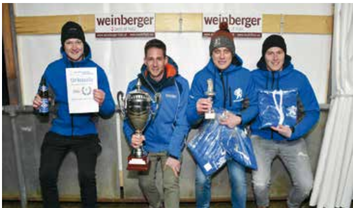
Die Siegermannschaft: Billardclub Reichenfels