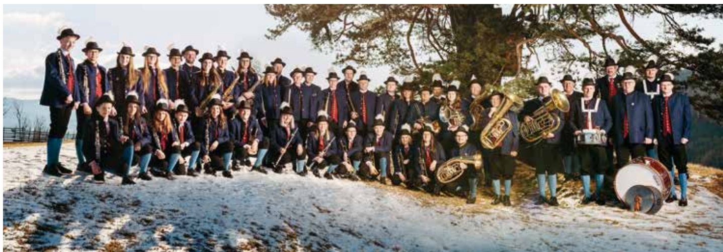
Über 40 Mitglieder freuen sich auf zahlreiches Publikum beim Frühjahrskonzert.