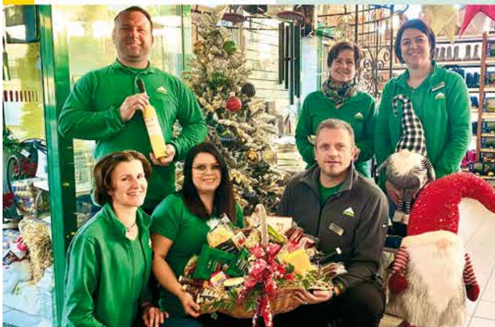
Das Lagerhaus Bad St. Leonhard-Team bedankt sich für die Treue und das Vertrauen, wünscht Frohe Weihnachten im Kreise der Familie sowie einen guten und gesunden Rutsch in das neue Jahr!

Raiffeisen-Lagerhaus Lavanttal reg.Gen.m.b.H. Bahnhofstraße 154 9462 Bad St. Leonhard Tel: 04350 / 2330 stleonhard@lagerhaus-lavanttal.at www.lagerhaus-lavanttal.at