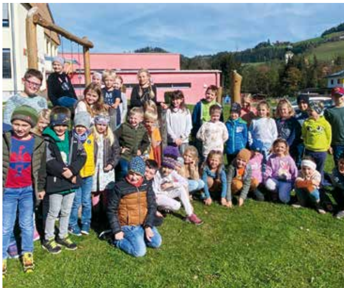
Patenaktion: Soziales Lernen in einer ganz besonderen Form verbirgt sich hinter der Patenaktion. Unsere Großen sind für unsere Kleinen da. Super!