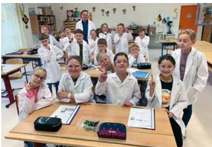
NAWI: Naturwissenschaftliches Arbeiten im Rahmen von NAWI begeistert die Schülerinnen und Schüler der 3. und 4. Klasse.