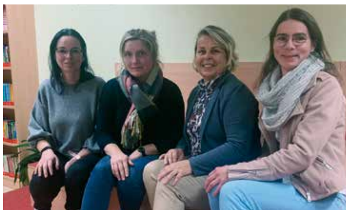
Vielen Dank an das engagierte Team der Klassenelternvertreterinnen. Wann immer wir ihre Unterstützung brauchen (BeLL-Fest, Keksaktion, ...) sind die Damen sofort zur Stelle.

Der Schutz unseres Planeten ist uns allen ein Herzensanliegen. Deshalb wird Ihre Gemeindezeitung ausschließlich mit CO 2 -frei gewonnener Energie aus 100 Prozent heimischer Wasserkraft hergestellt.