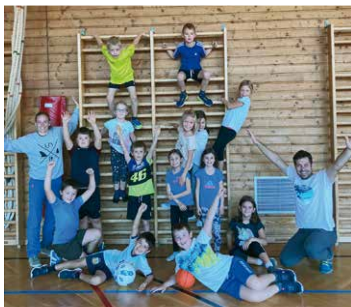
Die Schülerinnen und Schüler der 2. Klasse nehmen an der österreichweiten MOBAK Studie (Mobilitäts- und Aktivitätsstudie) teil.