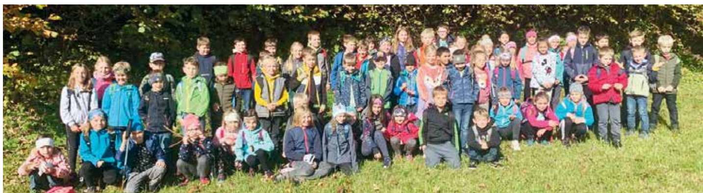
Am 7. Oktober wanderten alle gemeinsam zur Kölzer Quelle und erfreuten sich am wunderbaren Herbst.