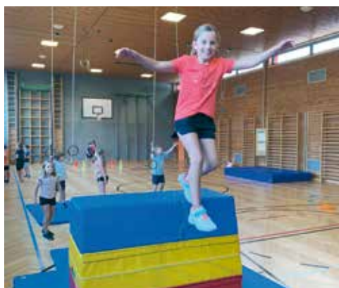
Hopsi Hopper: Die tolle Bewegungsaktion des ASKÖ bringt monatlich Spiel, Sport und Spaß für alle Mädchen und Buben.