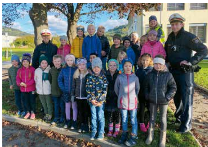
Verkehrserziehung mit einem Team der Polizei Bad St. Leonhard