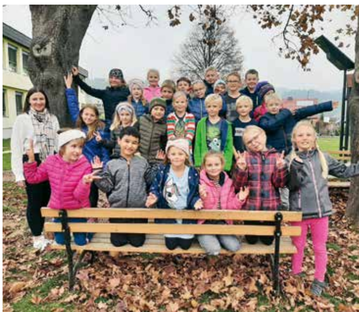
In diesem Schuljahr besuchen wieder 24 Buben und Mädchen die schulische Tagesbetreuung. Die verlängerten Betreuungszeiten (Donnerstag und Freitag bis 15:00 Uhr) wurden begeistert angenommen. Wie auf den Fotos sichtbar, macht die gemeinsame Freizeit in der Schule allen Buben und Mädchen großen Spaß.