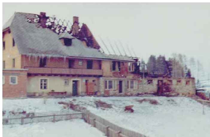
Brand beim vlg. Lippadam 1969